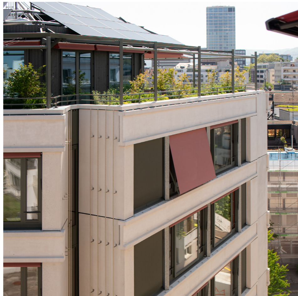
Blick auf die Dachterrasse, Haus irides

Unsere flexiblen Angebote passen sich Ihrem Alltag an. Ob hausinterne Spitex, Mahlzeitendienst, Reinigung oder Wäscheservice – Sie entscheiden, wie Sie leben möchten. Dabei stehen Ihnen unser Fachpersonal, umfassende Serviceleistungen und eine moderne Infrastruktur jederzeit zur Seite.